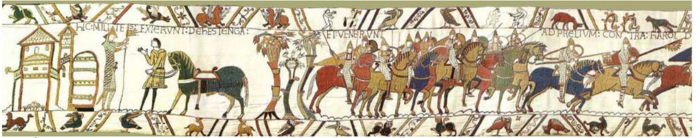
VII. hic milites exierunt de Hestenga et venerunt ad pr[oe]lium contra Harold(um)