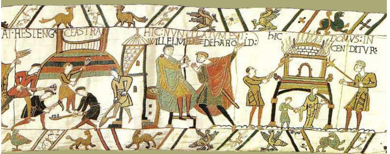
VI. ad Hestenga Castra ; hic nuntiatum est Willelmo de Harold[o]; hic domus incenditur