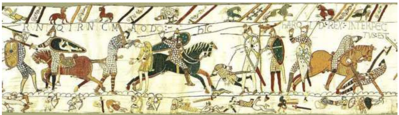
X. -runt qui erant cum Haroldo hic Harold Rex interfectus est