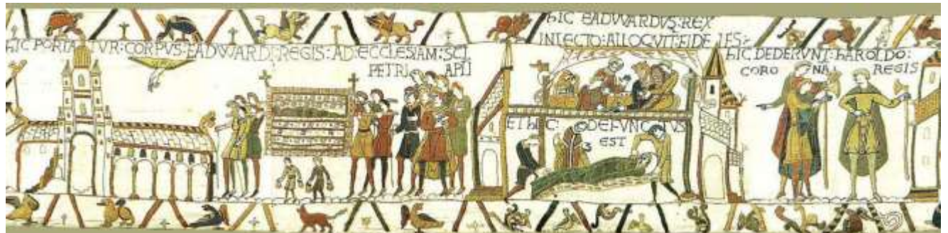
II. hic portatur corpus Edwardi regis ad ecclesiam s[an]c[t]i Petri Ap[osto]li hic Edwardus Rex in lecto alloquit[ur] fideles et hic defunctus est hic dederunt Haroldo corona[m] Regis