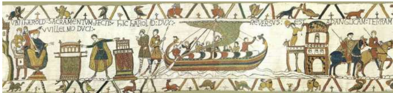
I. ... ubi Haroldus sacramentum fecit Willelmo Duci; hic Haroldus reversus est ad Anglicam Terram