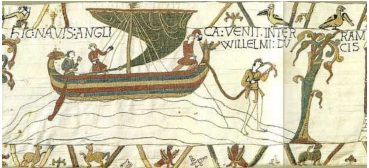
IV. hic navis Anglica venit in terram Willelmi Ducis