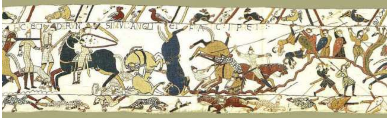
VIII. hic ceciderunt simul Angli et Franci in pr[o]jelio