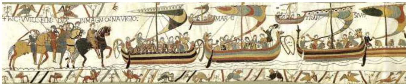
V. hic Willelm Dux in magno navigio mare transivit