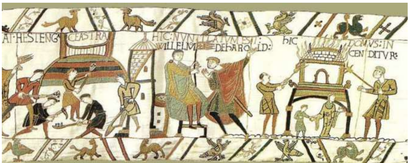
VI. ad Hestenga Castra ; hic nuntiatum est Willelmo de Harold[o]; hic domus incenditur