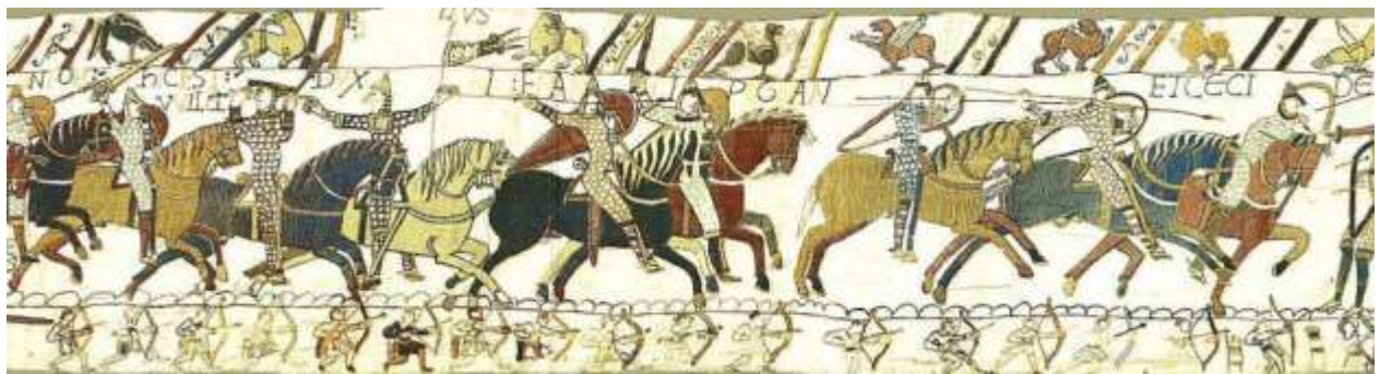
IX. confortat pueros hic est Willelm Dux hic Franci pugnant et cecide-