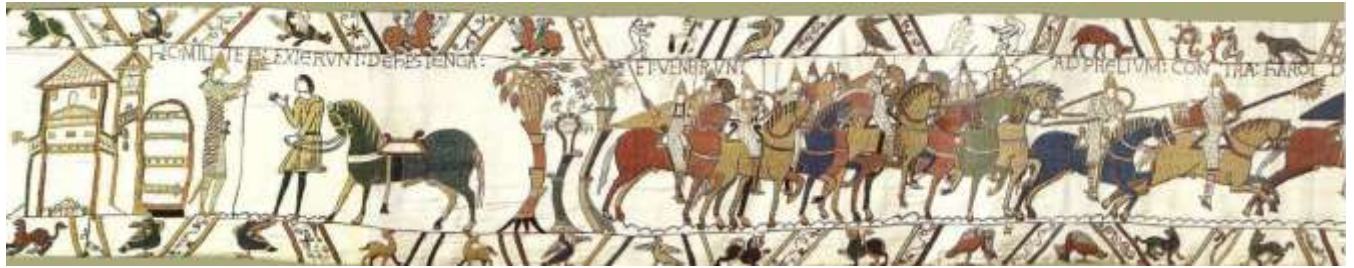
VII. hic milites exierunt de Hestinga et venerunt ad pr[o]jelium contra Harold(um)