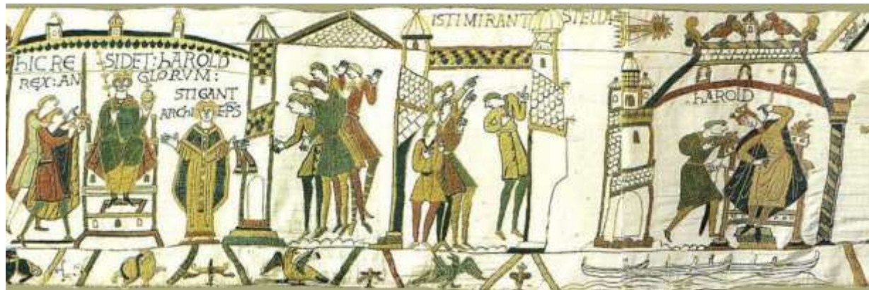
III. hic residet Harold Rex Anglorum Stigant Archiep[iscopu]s isti mirant[ur] stella[m]